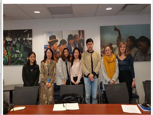
UN WOMEN, 인터뷰 후 기념 촬영