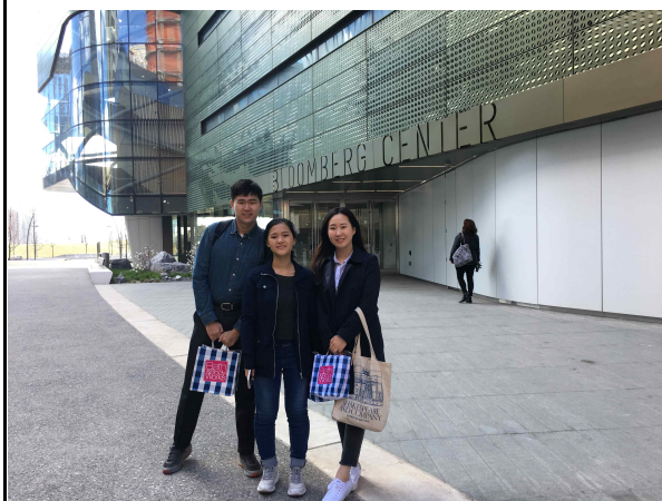
코넬 TECH의 블룸버그 센터 앞에서