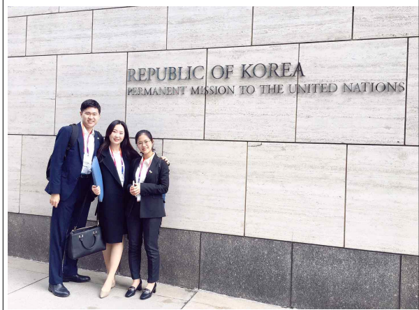
D패스를 위해 방문한 주유엔 대한민국 대표부