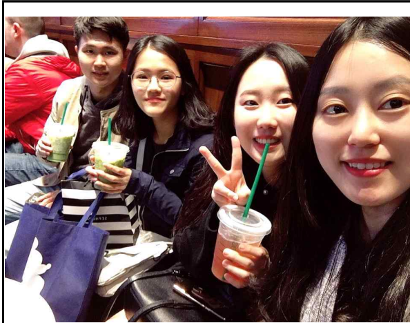
사무관님과 파견단, 미국 도착 첫날 카페에서

※ 사진 자료는 " 2.활동사진 " 부분에 최소 12매 이상(페이지 당 6매) 삽입하되, 사진 한 장당 용량은 500KB로 조정하고 각 사진 하단부에 간략한 설명을 넣을 것.